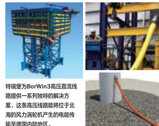
特瑞堡为BorWin3高压直流线路提供一系列独特的解决方案，这条高压线路能将位于北海的风力涡轮机产生的电能传输至德国内陆地区。

SUMMARY: As the world seeks fossil-free energy sources, wind power is becoming increasingly popular. For wind farm operators, offshore is usually the best location for plants due to higher velocity winds and less impact on communities. Trelleborg is currently delivering unique solutions for HVDC BorWin3, which will allow power generated by wind turbines in the North Sea to be transmitted to the German mainland. BorWin3 is the third in a series of power links undertaken by operator, TenneT, each named after the nearby island of Borkum. BorWin3 is significant in that it is only the third windfarm in the world to use “floatover” technology. Trelleborg is supplying six deck support units and six leg mating units (LMUs) that reduce impact forces during the mating operation.